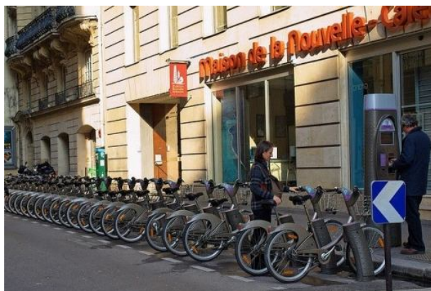
VELIB-állomás Párizsban

A regisztrációt követően a kerékpárokat bárki használhatja. A regisztrációs díj a tervek szerint lekerékpározható lesz. A tervezett díjrendszer elsősorban a rövid idejű és rövid távolságú utazásokkal számol, s erre ösztönöz. Ennek megfelelően a használat első fél órája ingyenes lesz, a következő fél óra 1 darab BKV jegy árának, minden további fél óra pedig 2 darab BKV jegy árának megfelelő összegbe kerül majd. Használat után fizetni bankkártyával, hitelkártyával, vagy akár mobiltelefonnal is lehet majd. A lopásoknak szigorú regisztrációval, a gyűjtőállomások mindegyikén elhelyezett kamerával, valamint egyedi kialakítású, speciális kerékpárokkal igyekeznek elejét venni.